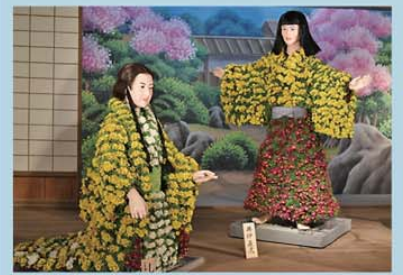
菊人形展「西郷どん」(予定) (写真は平成29年「おんな城主 直虎」より)

This year is the 111 th Kasama Chrysanthemum Festival. Approximately 10,000 pots of chrysanthemums fill the entire city having Inari Jinja Shrine at the top of the venues.